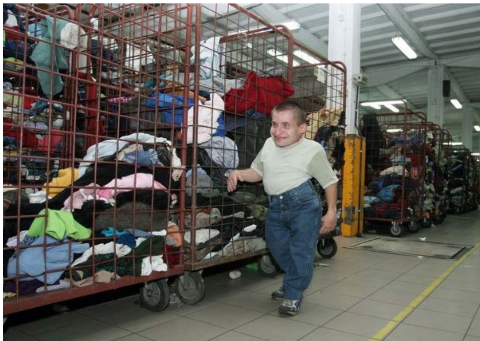
Zakład pracy chronionej w Skarżysku-Kamiennej

- Większość zakładów pracy chronionej upadnie, jeśli wejdą w życie rozwiązania proponowane przez rząd w ustawie o budżecie - alarmowali uczestnicy poniedziałkowej konferencji zorganizowanej przez Polską Organizację Pracodawców Osób Niepełnosprawnych.